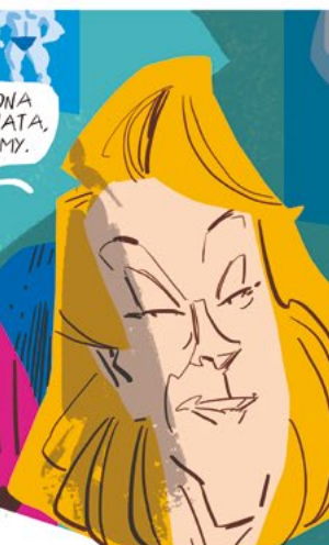
Il Condominio III - Vai?, Super Squalo Terrore, 2018