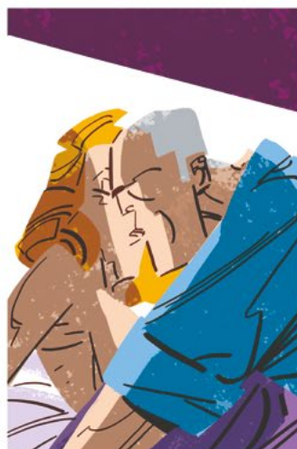
Il Condominio III - Vai?, Super Squalo Terrore, 2018