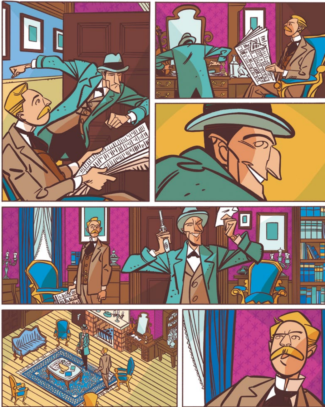
Mystery across the Channel, personal project, 2020